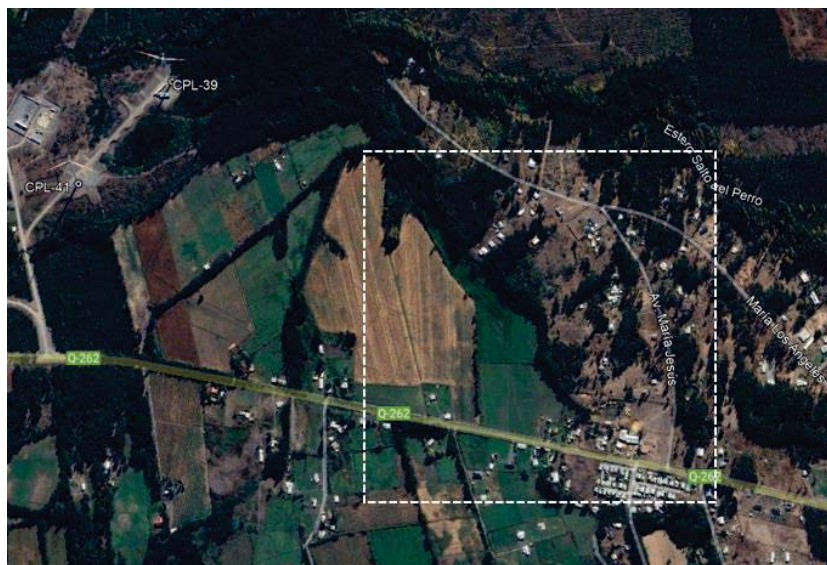
Figura 3. Área de evaluación efecto sombra, sector Av. María Jesús 34, Los Ángeles.